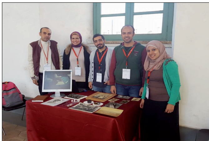
Figura 9 – Alcuni degli studenti partecipanti alla rassegna nazionale Arte è Scienza, Catania, 2-4 dicembre 2016