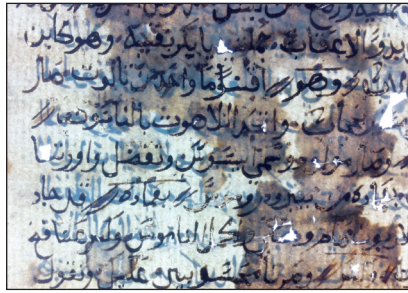
Figura 5 – Carte di un manoscritto islamico con degrado prodotto dall'inchiostro metallo gallico

All'interno della BA, oltre agli uffici dedicati alla catalogazione, abbiamo frequentato soprattutto i laboratori di conservazione dove, per alcuni giorni, su invito della direzione, si sono svolte delle lezioni per il personale del laboratorio aperte anche agli studenti del master. Le lezioni sono state incentrate su un problema poco noto ai conservatori egiziani: quello della manifattura e del degrado dovuto agli inchiostri metallo gallici. Il problema è poco noto in Egitto perché la maggior parte dei documenti manoscritti orientali sono stati vergati con inchiostri al nerofumo; tuttavia non sono stati rari i casi, riscontrati in mia presenza, di manoscritti e documenti archivistici redatti con inchiostri metallo gallici. Mi è sembrato utile pertanto approfondire questa tematica con lezioni teoriche e pratiche legate sia alla manifattura degli inchiostri sia alle nuove soluzioni predisposte a livello internazionale per la loro conservazione 26 .