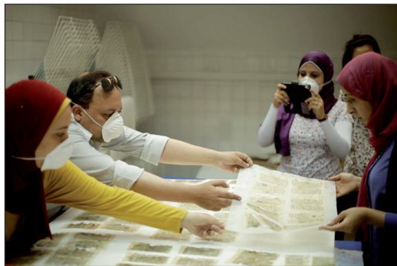
Figura 3 – Un gruppo di lavoro esegue il lavaggio di un libro e documenta le fasi di lavoro

Ogni gruppo ha discusso con grande spirito critico il proprio progetto di restauro in una serie di tavole rotonde nelle quali abbiamo tutti ragionato sullo stato di salute dei documenti presentati, sulle possibili cause del degrado, sull'opportunità di preservare tutti gli elementi storici veicolati dai documenti e sull'efficacia dei trattamenti proposti. A seguito di queste tavole rotonde, ciascun gruppo ha definito più precisamente le proprie scelte e sono iniziati i lavori veri e propri di restauro.