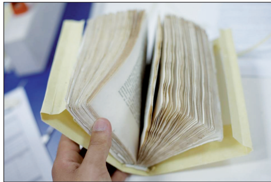
Figura 2 – Una legatura in pergamena floscia realizzata dagli studenti per uno dei progetti di restauro bibliografico

Le ore dedicate alle tecniche di legatoria storica si sono incentrate sulla manifattura di tipologie di legature storiche e conservative in pergamena floscia 8 e in carta e all’apprendimento delle tecniche di manifattura della legatura islamica e copta.