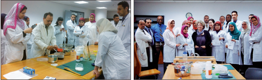
Figure 6 e 7 – Studenti e conservatori del laboratorio durante e dopo il seminario sulla manifattura dell'inchiostro metallo gallico