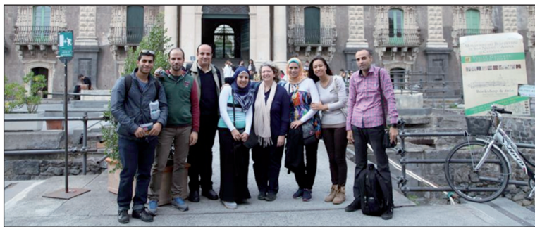
Figura 8 – Alcuni studenti al Dipartimento di scienze umanistiche dell'Università di Catania

Tutti gli studenti si sono confrontati con gli studenti italiani e i dottorandi con i quali hanno interagito con grande profitto sia per gli uni sia per gli altri.