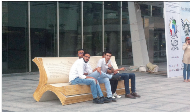
Figura 4 – Giovani nel piazzale antistante la Bibliotheca Alexandrina

La visita alla Bibliotheca Alexandrina e la possibilità, per alcuni studenti, di svolgere attività di tirocinio nei mesi di pausa del master, è stata senz'altro un'esperienza altamente formativa; la BA è un'istituzione all'avanguardia sotto molti aspetti, deputata alla disseminazione della conoscenza culturale e scientifica, ponte per il dialogo e la tolleranza, considerata come bene comune, gestita con un'ottica manageriale in tutti i suoi aspetti e in tutte le sue divisioni. La cultura della tolleranza e del dialogo fanno da sfondo a tutte le attività della biblioteca che organizza numerose iniziative ed eventi culturali di vario tipo tra cui l'annuale Fiera del libro, la mostra del libro d'artista, a cui partecipano artisti da tutto il mondo, eventi musicali e teatrali.