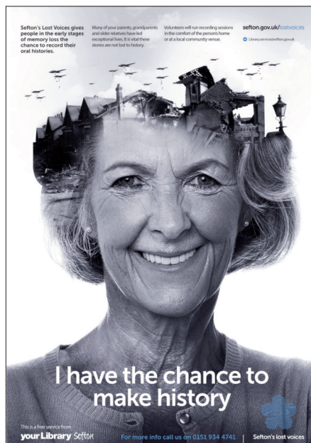
Figura 2 – Poster del progetto Lost voices di Sefton