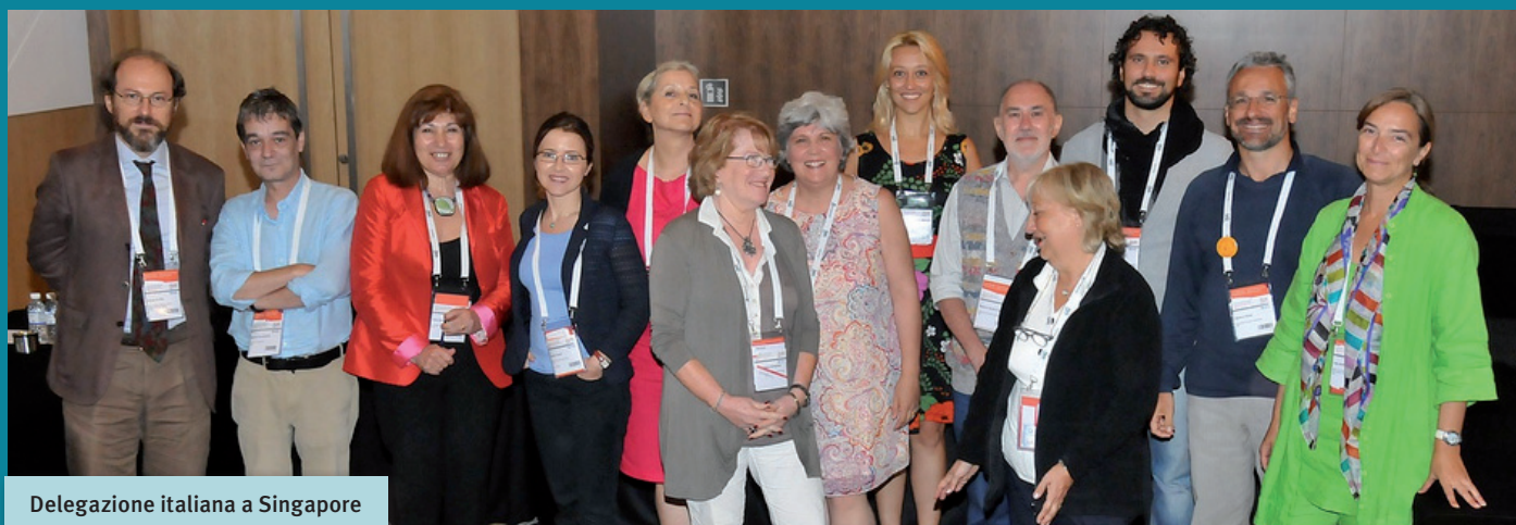
Delegazione italiana a Singapore

Per orientare il cambiamento, IFLA si è dotata negli anni più recenti di una Strategia ed ha effettuato nel 2013 un’analisi dei cambiamenti della società coinvolgendo esperti di diversa provenienza disciplinare. Il Convegno IFLA di Singapore sarà ricordato come la presentazione di questa analisi, chiamata Trend Report, che rappresenta una nuova fase delle attività della Federazione Internazionale, di cui si è parlato molto nelle Commissioni e nelle Sessioni della Conferenza. Il Trend Report è stato realizzato da esperti esterni al mondo delle biblioteche ed ha evidenziato cinque linee di tendenza: 1) la rapida crescita delle tecnologie e come queste possano migliorare o limitare l’accesso all’informazione; 2) l’espansione della formazione in linea e dell’impatto sulla democratizzazione e il riconoscimento formazione continua; 3) ridefinizione della privacy e della sicurezza dei dati in un mondo di dati aperti e sofisticati meccanismi di monitoraggio e filtro di dati personali; 4) comunità e minoranze che possono essere capaci di far sentire la loro voce nel