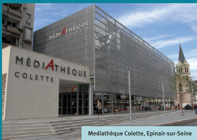
Mediathèque Colette, Epinay-sur-Seine

Le domande più curiose o interessanti vengono rieditate e pubblicate, oltre che sui siti bibliosesame.org e guichetdusavoir.org , anche sui siti delle biblioteche ( bpi.fr e http://bm-lyon.fr ) e sulle loro pagine facebook istituzionali, diventando uno strumento di promozione del