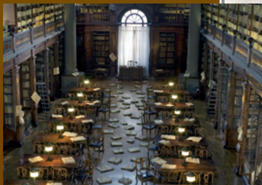
Alcune scene del film e la locandina