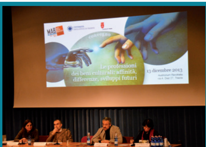
Trieste, 13 dicembre