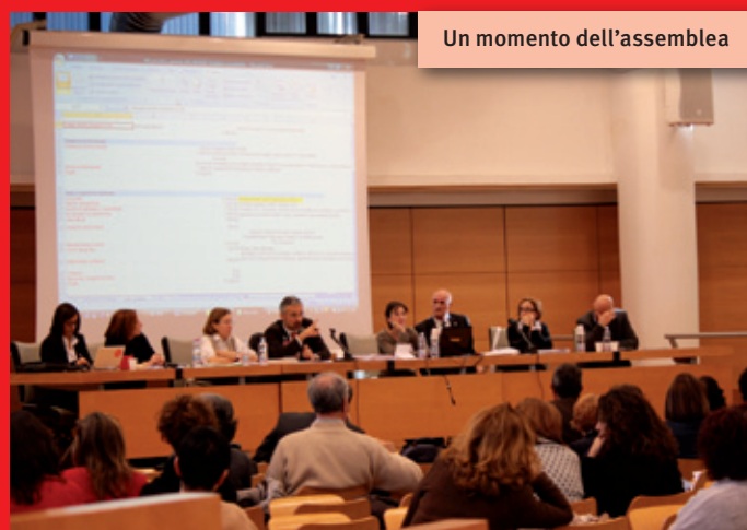
Un momento dell'assemblea