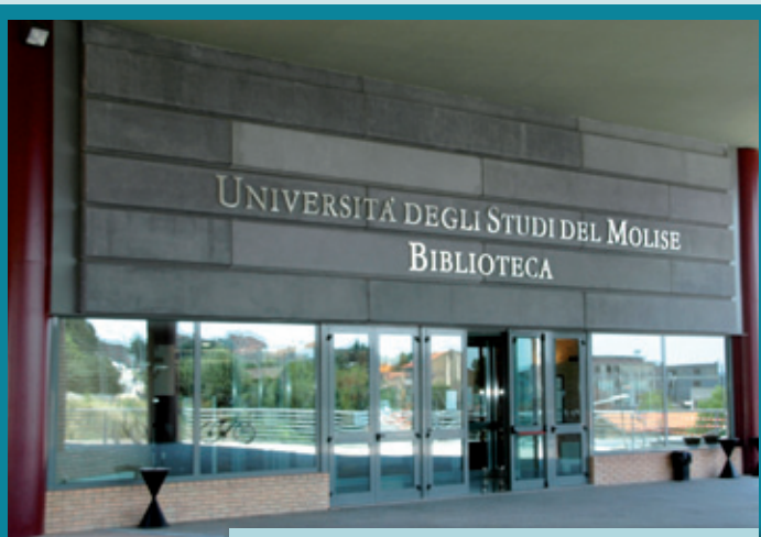
biblioteca dell'Università degli Studi del Molise

Nel novembre del 2011, sulla scia dell'attività politica nazionale a sostegno alle biblioteche pubbliche, l'AIB Molise ha organizzato un incontro pubblico con Antonella Agnoli, presso la Biblioteca provinciale "P. Albino" di Campobasso, dal titolo " Le piazze del sapere: con o senza libri ". L'incontro si è svolto come una conversazione tra la Agnoli, i bibliotecari molisani, gli amministratori e i referenti culturali sul ruolo della