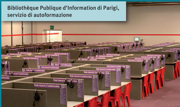
Bibliothèque Publique d'Information di Parigi, servizio di autoformazione