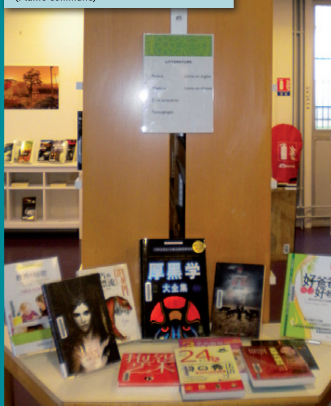
Bibliothèque André Breton, Aubevilliers (Plaine Commune)

Le biblioteche della Plaine Commune, territorio fortemente caratterizzato dalla presenza di giovani stranieri e persone non scolarizzate, principalmente operai e disoccupati,