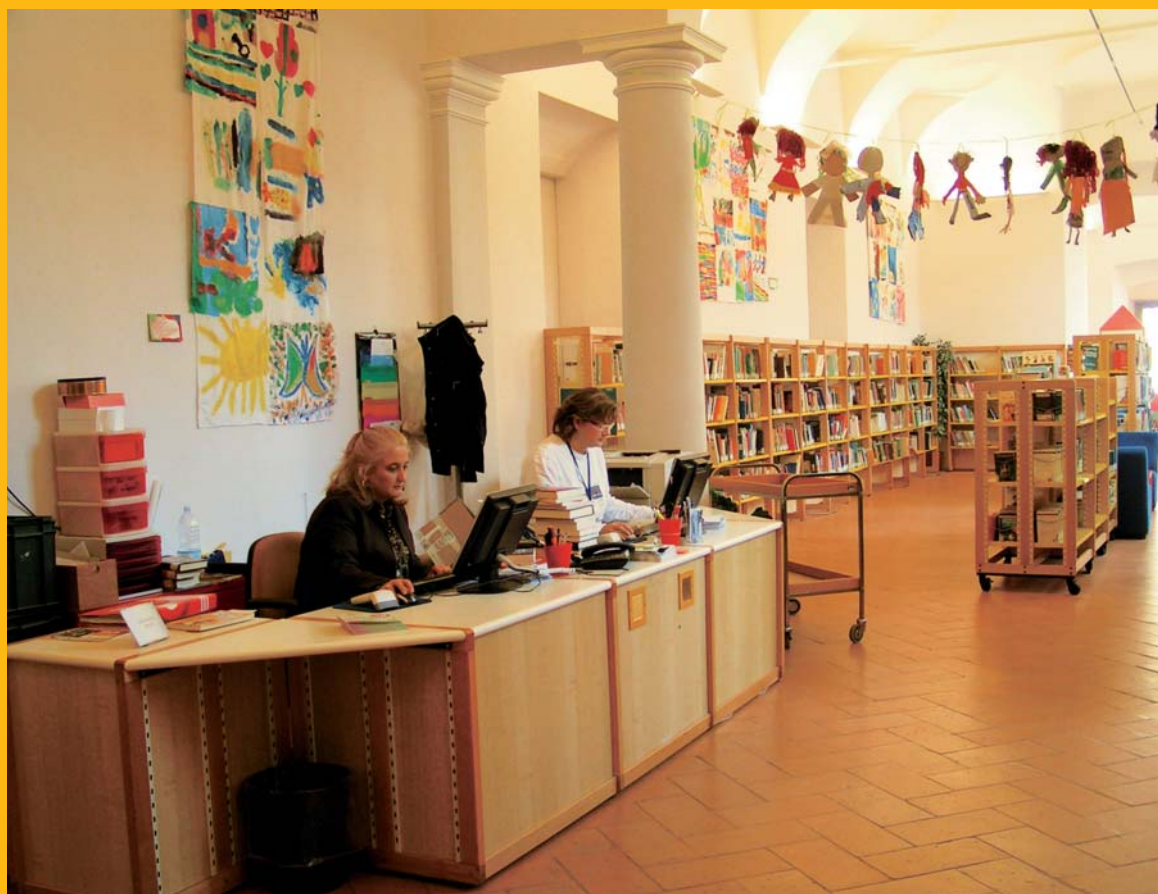
Biblioteca laudense, Lodi

Ci sono alcuni eventi in Lombardia che sono ormai entrati nella tradizione bibliotecaria! Quello più caro è la Giornata delle biblioteche lombarde , quest'anno arrivata alla 17 a edizione. In questa occasione, il 24 gennaio 2009, il nuovo CER lombardo ha ricevuto un caldo benvenuto dai soci, accorsi numerosi anche per assistere al seminario proposto, "Le relazioni interpersonali in biblioteca", il cui tema ha sicuramente richiamato l'attenzione. Gestire i rapporti interni all'ambiente di lavoro