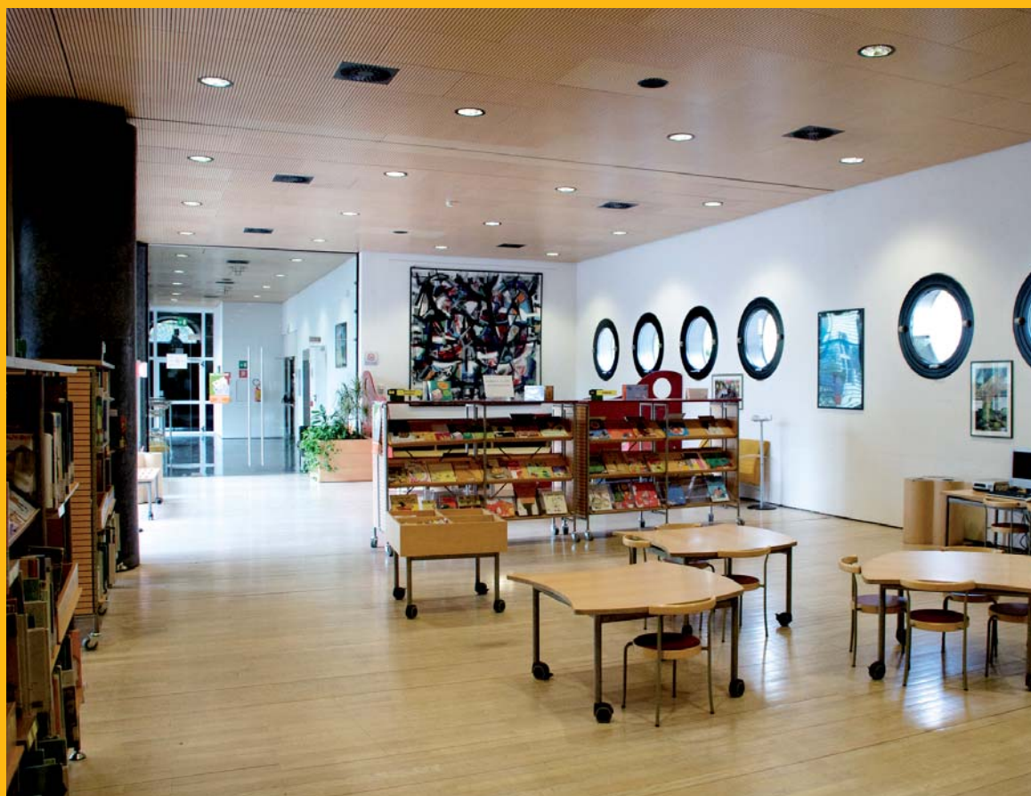
Biblioteca comunale di Rovereto

componenti di confrontarsi, a distanza, ma anche "dal vivo", su alcune questioni cruciali introdotte dalle nuove Linee guida (centralità della posizione dell'utente adolescente, suo ruolo determinante nelle scelte bibliotecarie, crescente importanza assegnata alle strategie di cooperazione tra soggetti a vario titolo coinvolti nelle politiche – sociali, culturali, formative – a favore dei giovani adulti). Sarebbe auspicabile dedicare a questi temi momenti informativi e formativi (seminari, tavole rotonde, corsi), che permettano l'aggiornamento e la discussione tra gli operatori su un aspetto finora piuttosto trascurato nelle biblioteche italiane: quello del difficile e delicato rapporto con gli adolescenti, frequentatori poco assidui dei nostri servizi. La versione italiana delle Linee guida sarà disponibile sia sul sito dell'IFLA, che in formato cartaceo, in occasione del Congresso IFLA a Milano, insieme al depliant della Sezione Biblioteche per ragazzi e giovani adulti dell'IFLA, nella traduzione italiana prodotta, anche in questo caso, dalla Commissione, allo scopo di far conoscere nel nostro Paese l'intensa attività della sezione stessa. Il Congresso di Milano ha stimolato inoltre, nella nostra Commissione, il desiderio di contribuire con una specifica iniziativa: il risultato è la partecipazione al seminario pre-IFLA di Roma, dedicato alle campagne di promozione della lettura