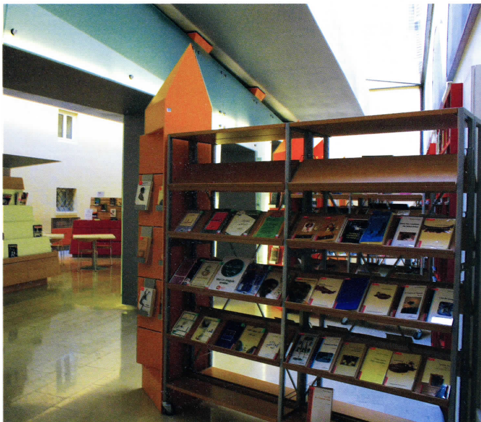
Biblioteca Delfini, Piazzetta. In primo piano gli espositori per le novità librarie. Sul fondo: edicola e bancarella dell'usato