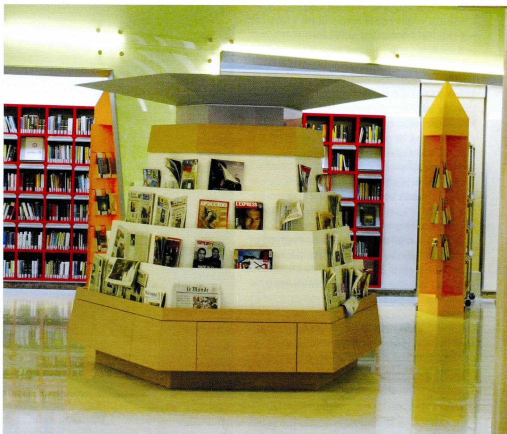
Biblioteca Delfini, Piazzetta. In primo piano l'edicola (giornali e settimanali d'attualità). Sul fondo: scaffali per i libri novità

L'arredo, in gran parte su misura, gioca su colori caldi e linee diagonali, e l'insieme crea un luogo d'aspetto moderno e insolito. Il nome che è stato scelto per indicare questo spazio è "piazzetta", che ci sembra adatto a riassumere i concetti appena espressi. Così, dopo tre anni di cantiere, dal 2003 al 2005, e sei mesi di convivenza con altri servizi - dall'apertura dei nuovi spazi il 7 dicembre 2005 - il 21 giugno scorso i nostri affezionati lettori di giornali si sono riappropriati di uno spazio "loro", dove troneggia l'edicola con i quotidiani del giorno e i settimanali di attualità; accanto, servizi affini: un televisore puntato sul televideo , due televisori collegati al satellite per ascoltare programmi informativi internazionali, l'edicola on line per consultare una lista di siti informativi italiani e stranieri. A questo blocco di servizi di informazione si affiancano gli espositori per le novità librarie , quasi una biblioteca nella biblioteca: la quantità di spazio disponibile, volutamente ricavato, consente infatti di raccogliere in piazzetta tutte le acquisizioni di un anno, con uno stile "da libreria" che speriamo invogli a leggere un libro in più. Terzo grande punto di attrazione, la banca dell'usato, servizio ormai