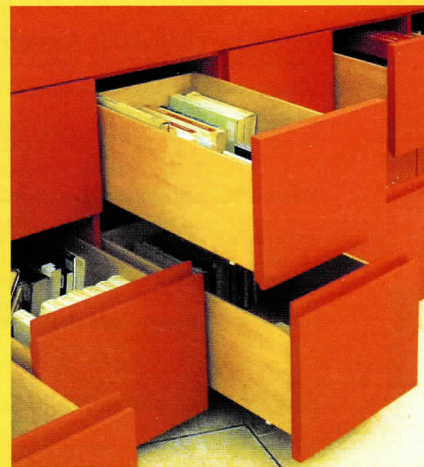
biblioteca delfini, bologna